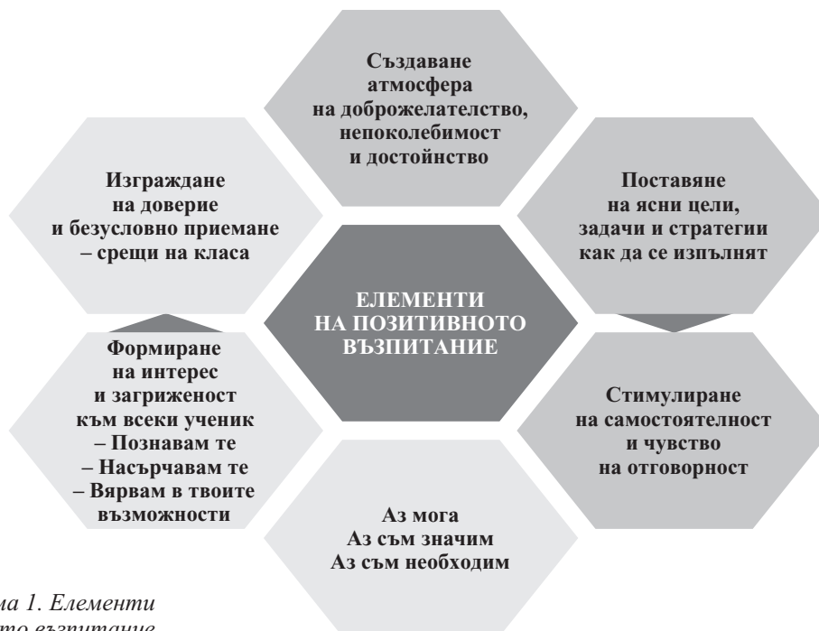
Схема 1. Елементи на позитивното възпитание

са посланията и на „позитивната класна стая“, станала обект на внимание през последните години сред успешните професионални практики в педагогиката. Моделът се отличава със свои елементи и особености и служи за ориентир в прилагането на съвременните идеи при работа с деца (схема 1).